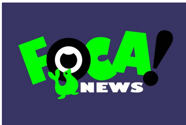
Figura 1: Marca Guarda-Chuva Foca News

Produto 2 - Criação da marca da Agência Jr. de Jornalismo Foca News – A Agência Jr. De Jornalismo proporcionará ao aluno, a oportunidade de vivenciar a busca de soluções para os problemas do cliente, o diagnóstico crítico, o planejamento e o desenvolvimento criativo, além da experiência que será vivida com o contato direto com o cliente e demandas complexas, cujas decisões são pautadas pelas necessidades impostas pelo seu contexto de mercado, todos os aspectos que escapam do ambiente controlado e seguro da sala de aula. Todas essas características, e muitas outras, do cotidiano de uma agência experimental farão com que elas sejam não apenas uma estrutura de apoio à atividade acadêmica, mas um compromisso que tem impactos na própria identidade do curso.