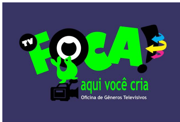
Figura 4: Logomarca da TV Oficina de Gêneros Televisivos

Produto 4 - Criação da marca TV Foca News: Oficina de Gêneros Televisivos – É uma oficina de gêneros televisivos que produzirá programas de diversos formatos, serão produzidos por estudantes para Canal Web, será disponível para os alunos praticarem e desenvolver as técnicas de produção e programas de entretenimento, um trabalho que será realizado para promover às habilidades dos produtores de programas de TV. A proposta é descobrir novos talentos em produção de formatos;