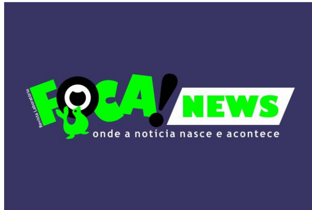
Figura 3: Marca da Revista Laboratório Foca News

Produto 4 - Criação da marca TV Foca News: Oficina de Gêneros Televisivos – É uma oficina de gêneros televisivos que produzirá programas de diversos formatos, serão produzidos por estudantes para Canal Web, será disponível para os alunos praticarem e desenvolver as técnicas de produção e programas de entretenimento, um trabalho que será realizado para promover às habilidades dos produtores de programas de TV. A proposta é descobrir novos talentos em produção de formatos;