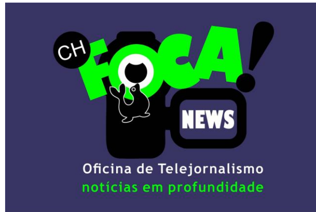
Figura 5: Logomarca do CH Oficina de Telejornalismo